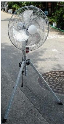
ハイスタンド扇風機