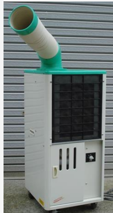
スポットクーラー