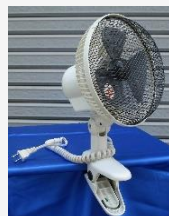
クリップ式扇風機