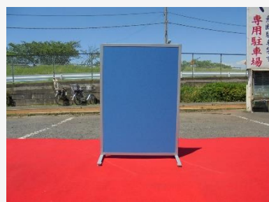
パーテーション (間仕切り用)