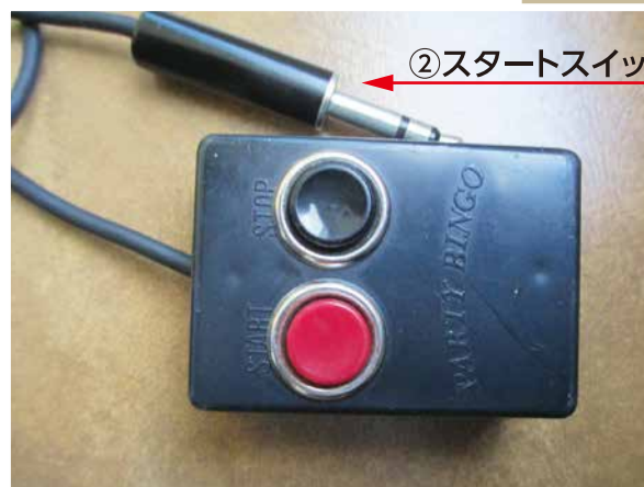
②スタートスイッチジャック